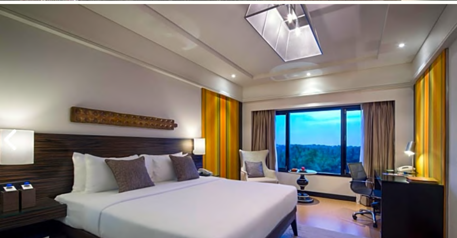
HOTEL RAINTREE ST MARYS RD - CHENNAI