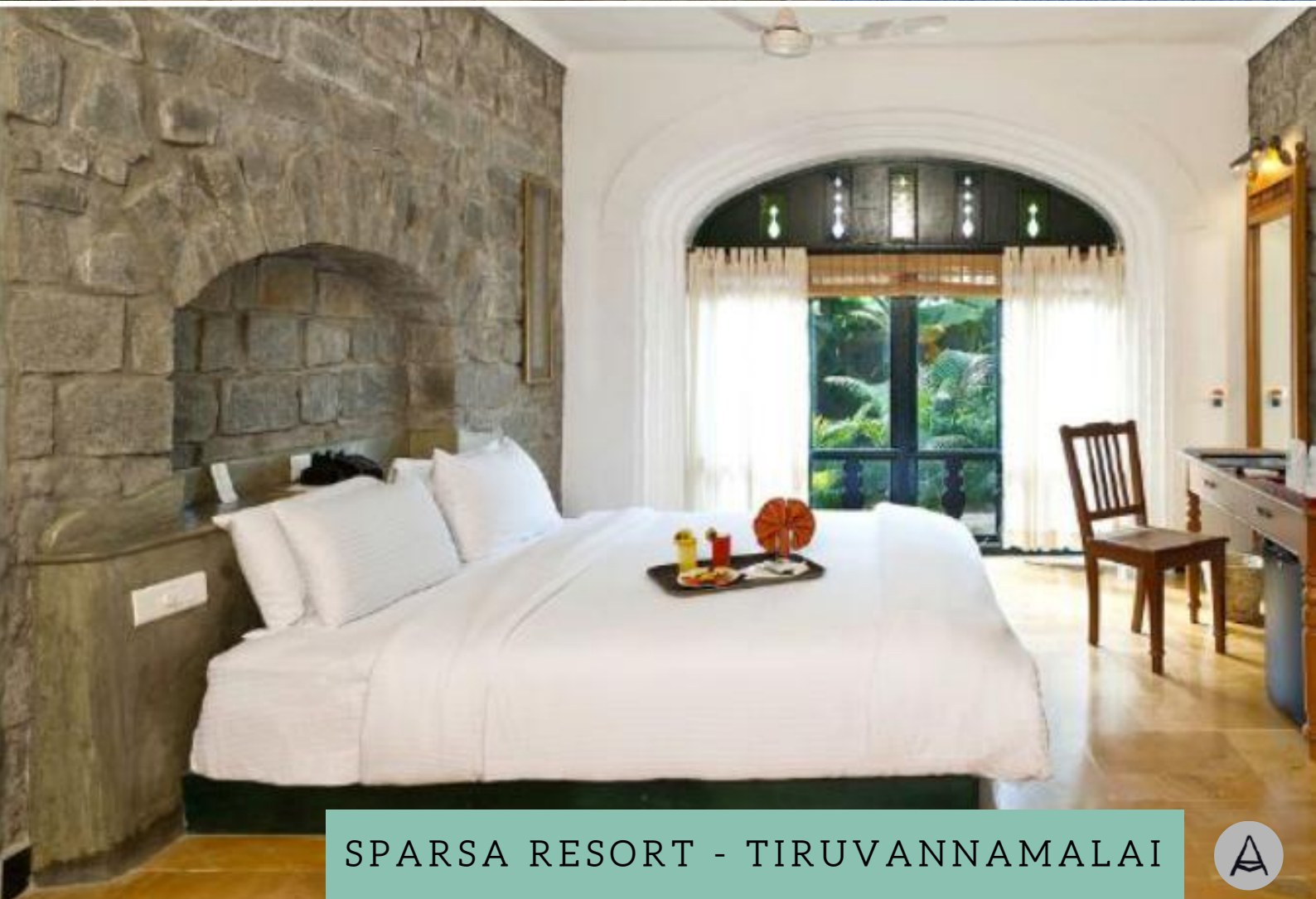
SPARSA RESORT - TIRUVANNAMALAI