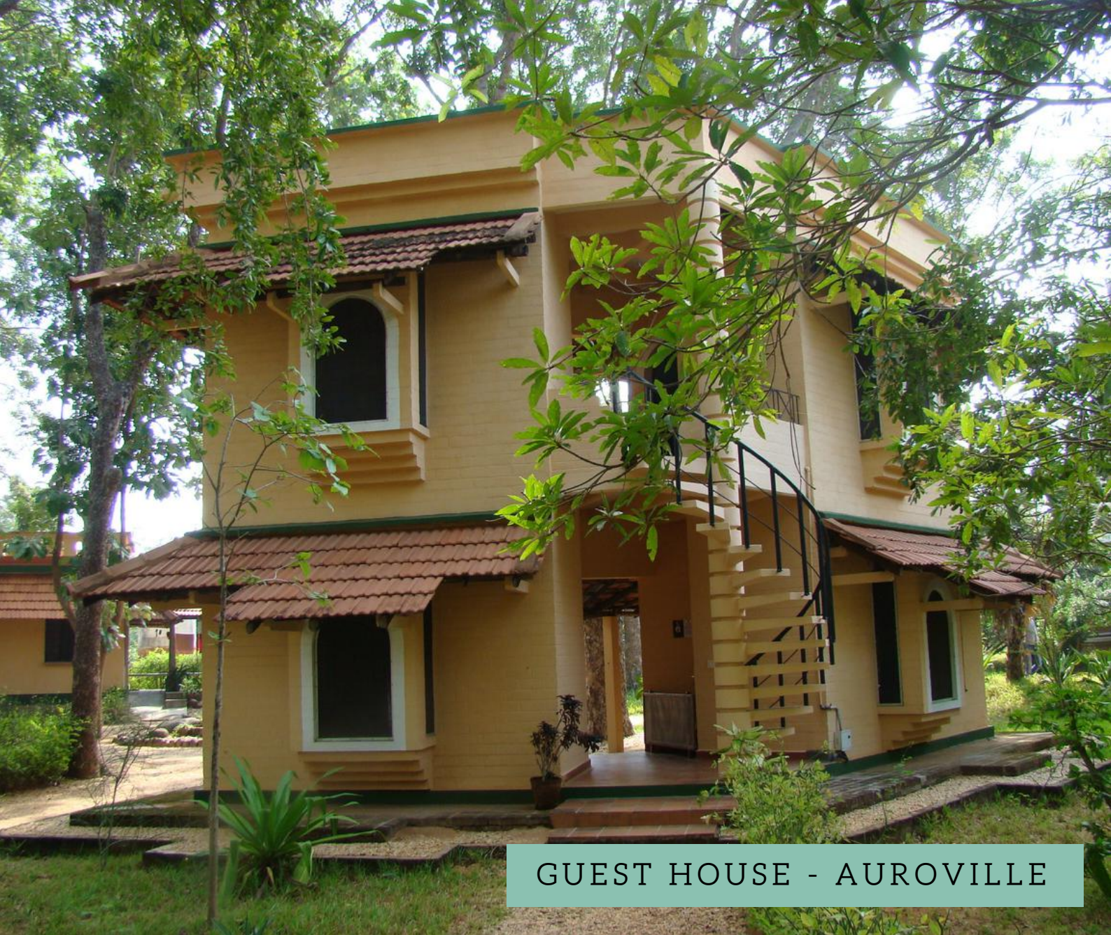
GUEST HOUSE - AUROVILLE